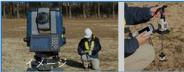
①優れた機器での測量作業を体験し、作業の快適さを実感してもらいます。