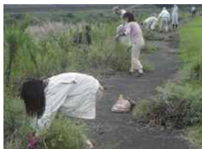
外来植物調査・駆除

水生生物の調査研究や、生態系を維持するために外来生物の駆除活動などを行い、河川環境を維持します。