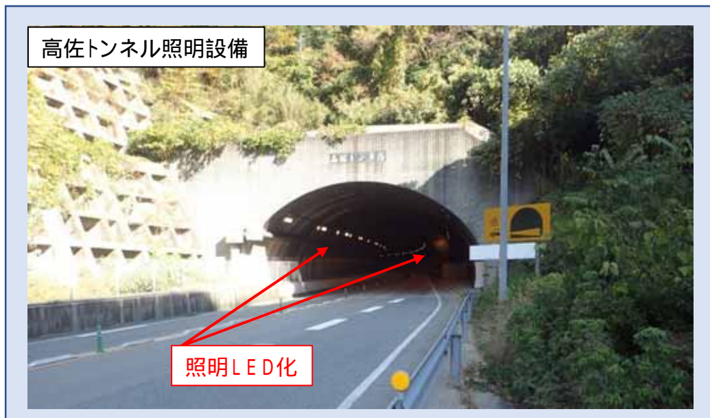
高佐トンネル照明設備