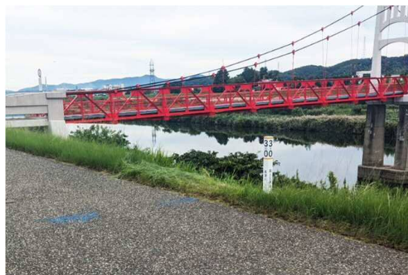
高津川右岸3k000 飯田吊橋付近 距離標