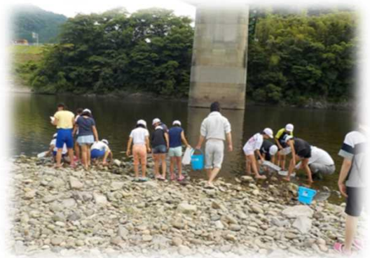
浜田河川事務所管内河川での実施状況