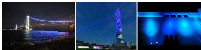
令和5年度 ブルーライトアップの様子

全国のブルーライトアップ実施施設は国土交通省水管理・ 国土保全局WEBページよりご覧になれます。 https://www.mlit.go.jp/mizukokudo/mizsei/mizukokudo_mizsei_tk1_000080.html