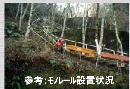
参考：モルル設置状況

●先月号で契約のお知らせをしておりました地質調査ですが12月の中頃から調査を開始する予定です。山の上でのボーリング作業には機材運搬のためのモルル設置、伐採作業が不可欠です。該当の地権者の方々へは別途ご説明します。