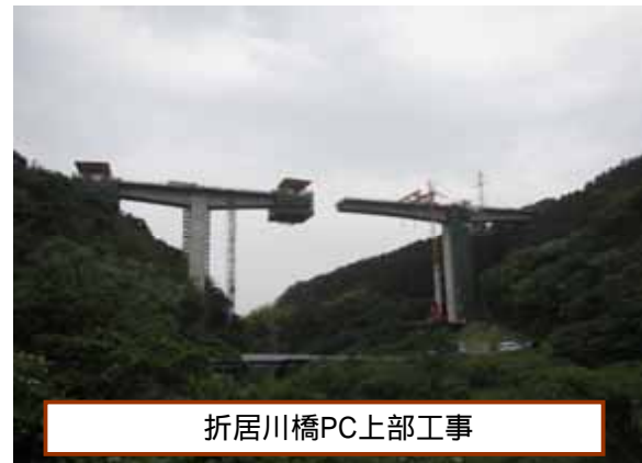
折居川橋PC上部工事