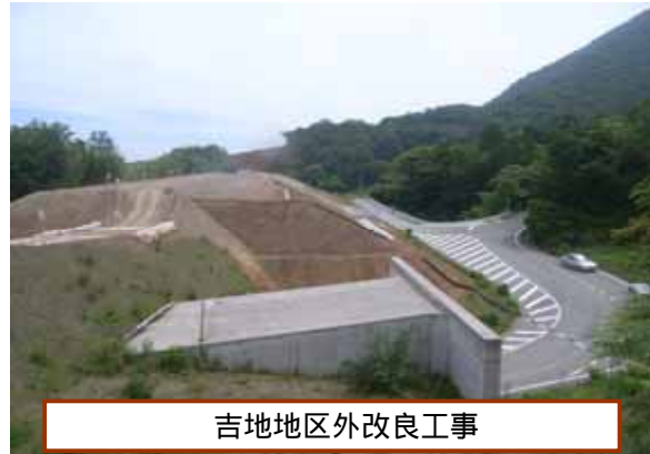
吉地地区外改良工事