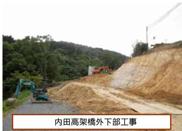
内田高架橋外下部工事