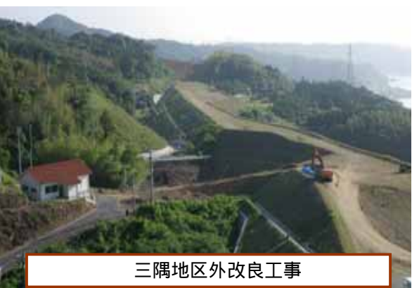
三隅地区外改良工事