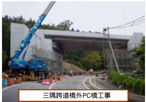
三隅跨道橋外PC橋工事