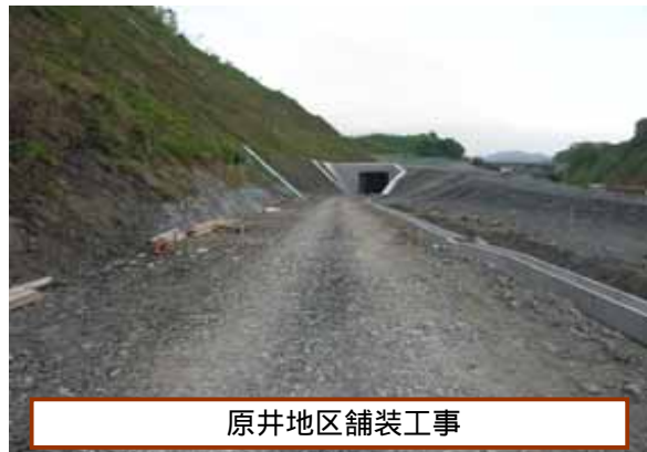
原井地区舗装工事