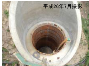
西村高架橋下部工事