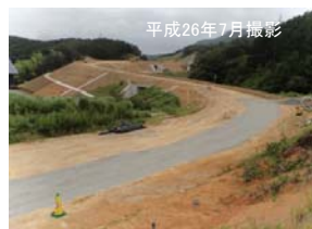
力石地区外改良工事