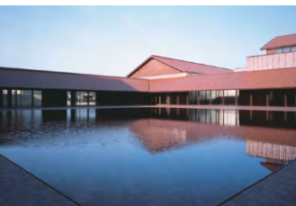
④島根県芸術文化センター グラントワ