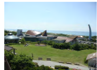
①しまね海洋館アクアス(浜田市)