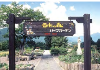
③香木の森公園(邑南町)