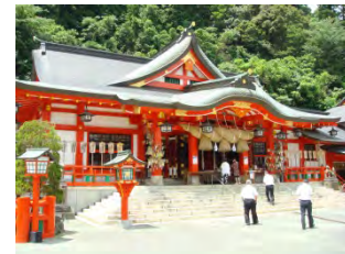
②太鼓谷稲成神社(津和野町)