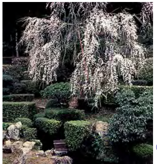
①医光寺／雪舟庭園のしだれ桜(益田市)