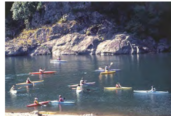
③カヌーの里おおち(美郷町)