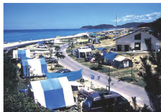
②石見海浜公園(浜田市・江津市)