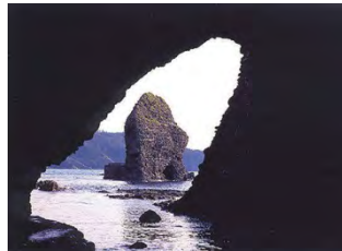
②石見曇ヶ浦(浜田市)