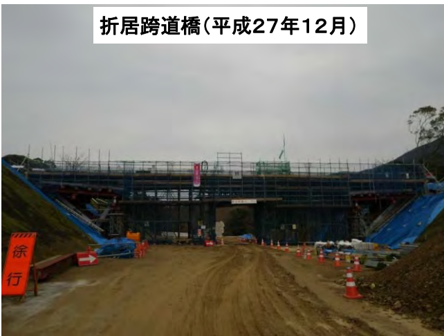
折居跨道橋(平成27年12月)