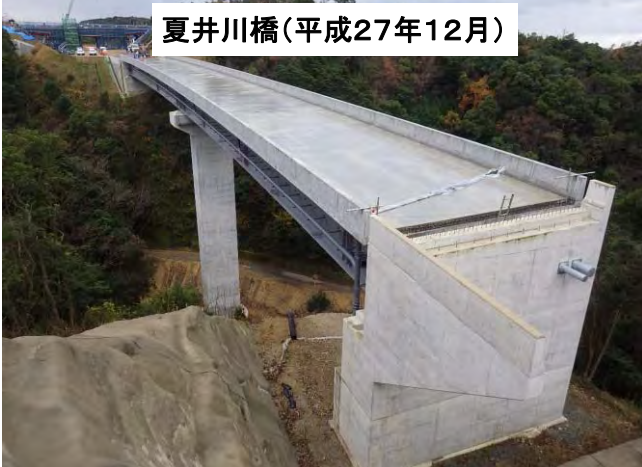
夏井川橋(平成27年12月)