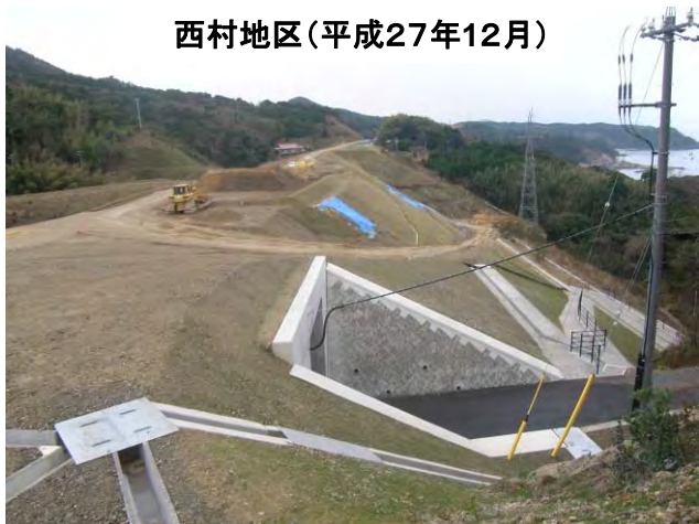
西村地区(平成27年12月)