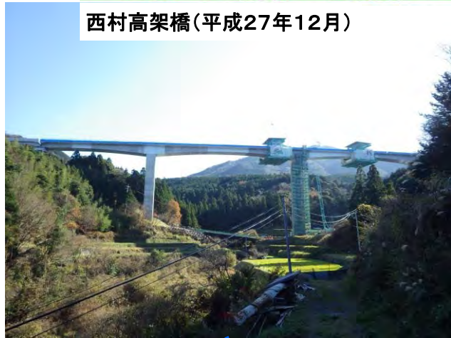
西村高架橋(平成27年12月)