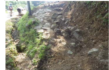
石畳(昭和に入って補修された跡がありました)