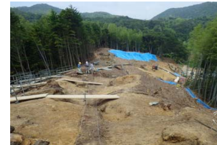
調査箇所の全景(くぼみの様子)

・榎坂窯跡(えのきざかかまあと)には、瓦の窯跡があったらしく、瓦の破片が多数散乱していて、登り窯の跡と思われる「くぼみ」がいくつも見つかりました。(幕末～近代にかけての瓦窯跡)