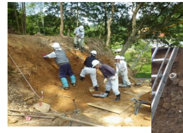
調査の様子(石垣が発見されました)

・三隅・益田道路建設予定地、益田市土田町地内では現在埋蔵文化財の発掘調査中です。山陰道馬橋(うまばし)地区では、江戸時代以降の山陰道の跡が見つかり、石畳が敷かれた道や、道の脇に石垣が積まれていたことがわかりました。