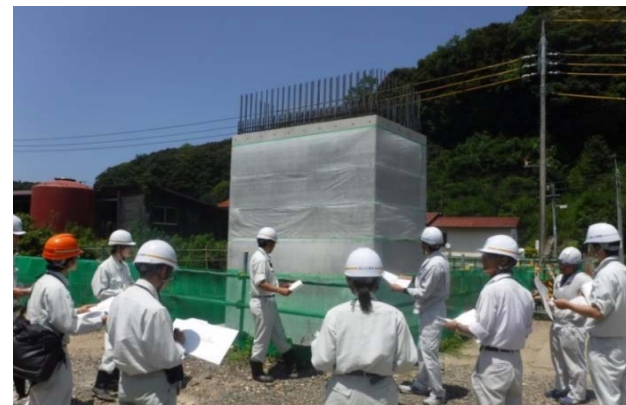
現場基礎技術研修の実施状況(7月7日撮影)