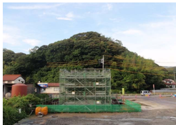
コンクリート打設のための型枠組立状況(6月末撮影)

また、7月7日には事務所若手職員及び出張所係長を対象とした、現場基礎技術研修が行われました。現場では施工業者の説明に対し、研修生からの活発な質問がみられました。