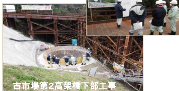
古市場第2高架橋下部工事

島根県の方も、三隅・益田道路事業には興味を持っておられ、島根県の東西が、早く山陰道一本でつながるよう、大いに期待されていました。