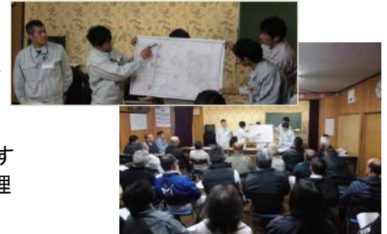
【工事説明会の様子】

12月3日に上古市集会所で工事説明会を行いました。工事説明会では、地元の皆様これから工事着手する工所用道路の工事内容の説明を行い、工事へのご協力をお願いをさせていただきました。今後、その他地区においても工事着手前には、工事説明会を開催する予定です。早期開通に向け工事を進めて参りますので、皆様のご理解・ご協力をお願い致します。