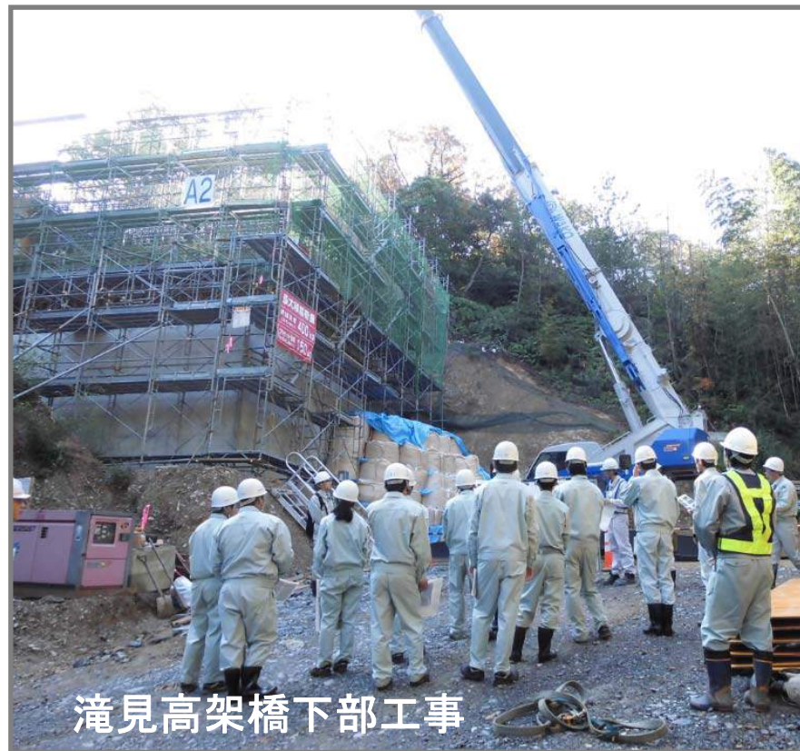
滝見高架橋下部工事

今回の見学会は、島根県建設業協会が窓口となり開催されました。島根県建設業協会では、建設産業の若手技術者確保の一環として、高校(建設系学科)に学ぶ高校生を対象に、建設業に対する関心と学習意欲を高めるため、「高校生の現場見学会」に取り組んでいます。