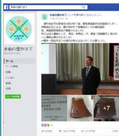
【鎌手地域魅力化推進協議会 フェイスブック「水仙の里かまて」より】

11月20日に行われた鎌手地区文化祭において、三隅・益田道路事業で行われている埋蔵文化財調査の発掘調査報告会が開催されました。