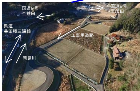
岡見IC(工事用道路)【H29.2.2撮影】