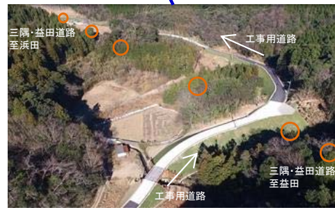
工事用道路(木部地区)【H29.2.2撮影】