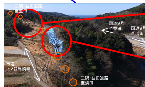
馬橋高架橋建設予定地【H29.2.3撮影】