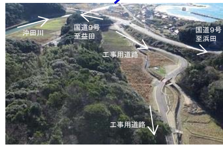
工事用道路(木部地区)【H29.2.2撮影】