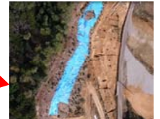
埋蔵文化財調査跡【H29.2.3撮影】