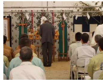
大浜地区自治会長