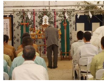
木部地区自治会長