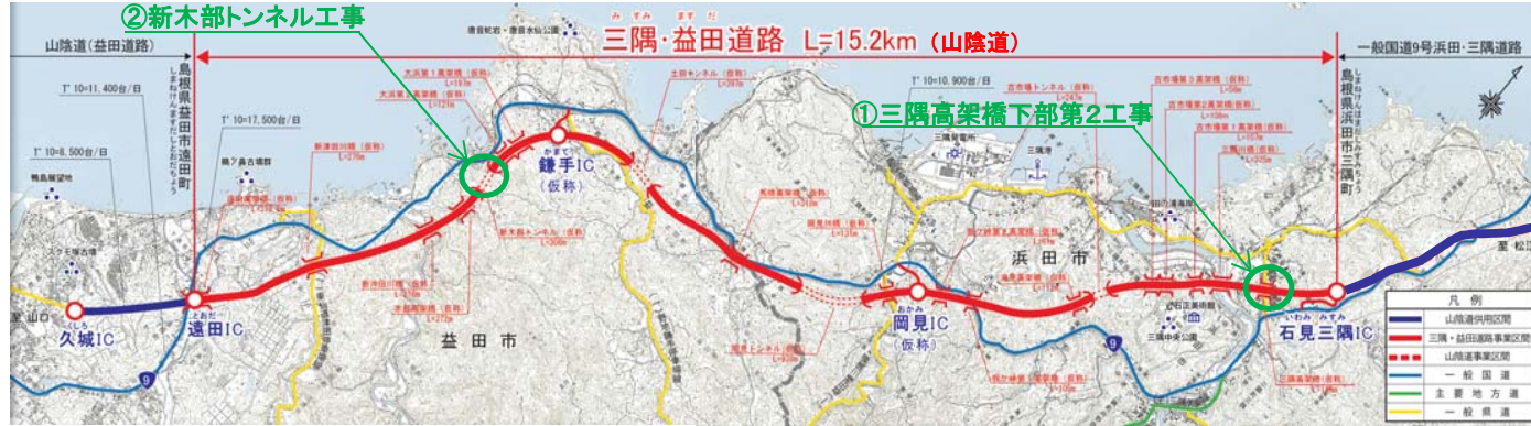
※この地図は、国土地理院長の承認を得て、国土地理院発行の2万5千分1地形図を複製したものである。 (承認番号 平23 中複 第86号)

平素より三隅・益田道路事業にご理解とご協力をいただきありがとうございます。 三隅・益田道路事業では様々な工事の施工を行っていますが、本号では「三隅高架橋下部第2工事」と「新木部トンネル工事」の工事状況について紹介します。