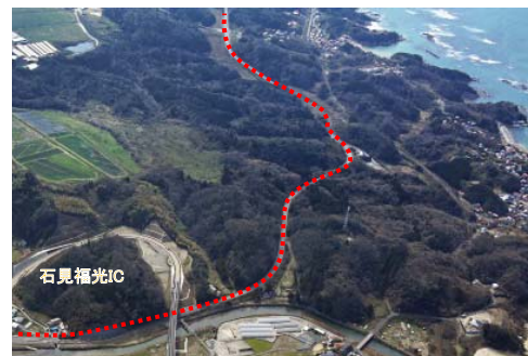
国道9号現況写真（線形不良箇所）

国道9号 福光・浅利道路(大田市温泉津町～江津市松川町間)は、急カーブや急な坂道、土砂災害危険箇所などの国道9号の問題を解消し、交通安全や緊急時の代替ルートを確保します。