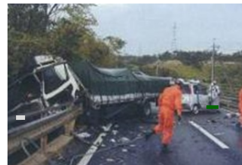
国道9号現況写真（交通事故状況）