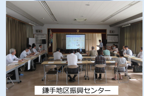
鎌手地区振興センター