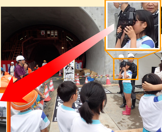
児童の皆さんに、現実映像とコンピュータグラフィックを融合させた映像技術を体験してもらいました。