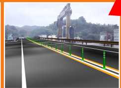
トンネルや道路の完成イメージが見えています。