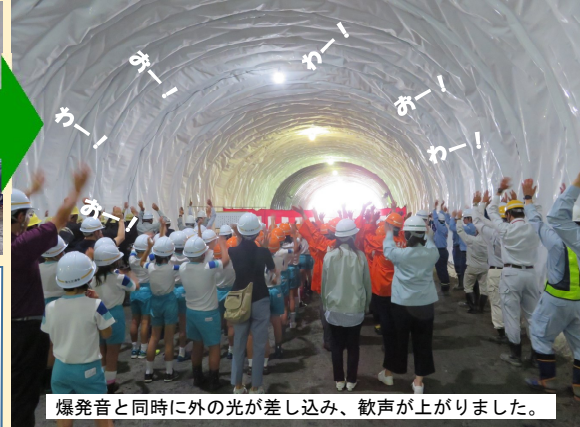
爆発音と同時に外の光が差し込み、歓声が上がりました。