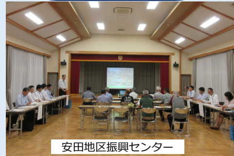
安田地区振興センター