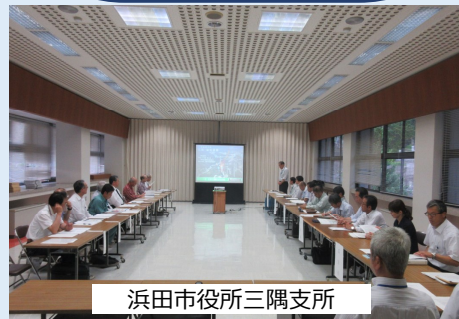
浜田市役所三隅支所