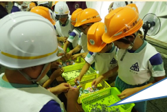
貫通のお守り作りの様子

＜貫通石＞ トンネル貫通時の石として「難関突破」や「初志貫徹」などの石（意思）を貫くの意味合いから合格祈願や結婚記念に人気です。