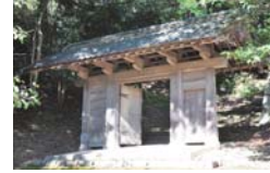
浜田城跡に移設されている旧浜田県庁の門