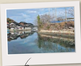
北前航路の湊を連想させる 瀬戸ヶ島の船溜まり