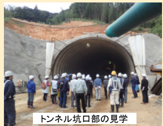
トンネル坑口部の見学

11月8日に益田市安田、鎌手地区にお住まいの方々(32名)を対象とした工事現場見学会を行いました。見学会では、土田トンネルの工事現場を見ていただき、「トンネルの造り方」、「建設機械」の大きさなどを実感していただきました。