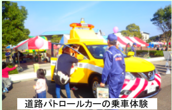
道路パトロールカーの乗車体験