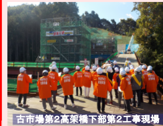
古市場第2高架橋下部第2工事現場

11月6日にゆうひライン女性の会※(23名)による現場見学会を開催しました。現場見学会では、三隅・益田道路の工事の進捗を実感していただきました。現場見学終了後、意見交換を行い、山陰道の早期全線開通に対する熱い思いや願いをいただきました。