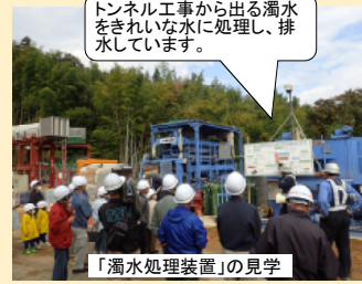
「濁水処理装置」の見学