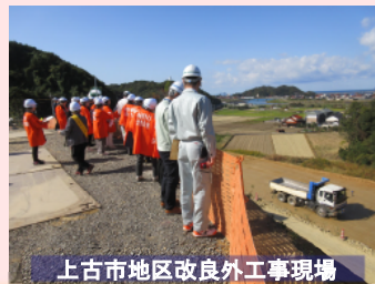
上古市地区改良外工事現場