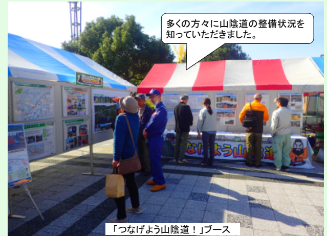
「つなげよう山陰道！」ブース

11月11日に三隅中央公園で開催された「みすみフェスティバル」で、島根県埋蔵文化財調査センター、三隅・益田道路安全協議会、浜田河川国道事務所の共同で「つなげよう山陰道！」ブースを出展させていただきました。山陰道のパネル展示の他、三隅・益田道路の埋蔵文化財調査で発掘された陶磁器などの展示や、冬用タイヤの早期装着の啓発、道路パトロールカーの乗車体験も行いました。天気も良く多くの皆さんが来場され、大変良い活動となりました。