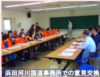
浜田河川国道事務所での意見交換

※ゆうひライン女性の会は、暮らしの安全・安心を願う生活者の立場、女性の立場から、高速道路の必要性や役割について理解を深め、関係機関・県内外に意見を積極的に発信し、浜田-益田-萩間の山陰道早期整備を求める地域応援団となることを目的として活動しています。また、ゆうひライン女性の会 Facebookでは、山陰道に関するいろいろな情報を発信されていますので、みなさんご覧になって下さい。