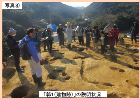
「郭1(建物跡)」の説明状況