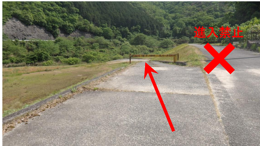
進入路状況（9:00開門、15:15閉門）