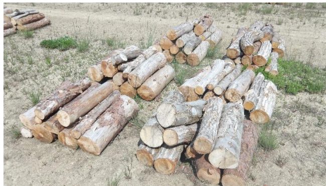
長さ60cm、会場中央部に配置