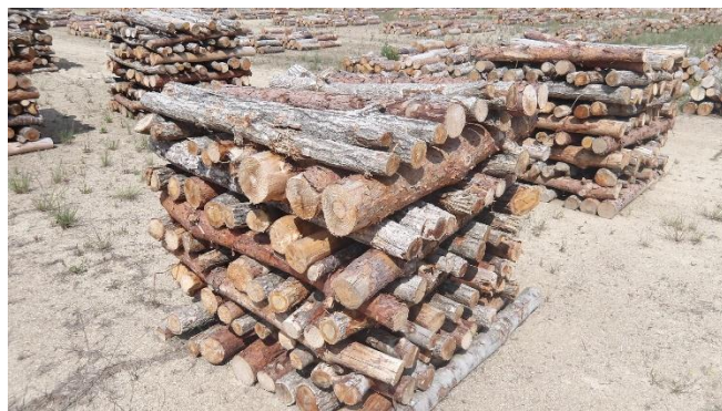
長さ1.2m、会場奥側に配置

○ 現地到着が9:00以降になるように集合をお願いします。詳細は「会場までの待機方法」参照。