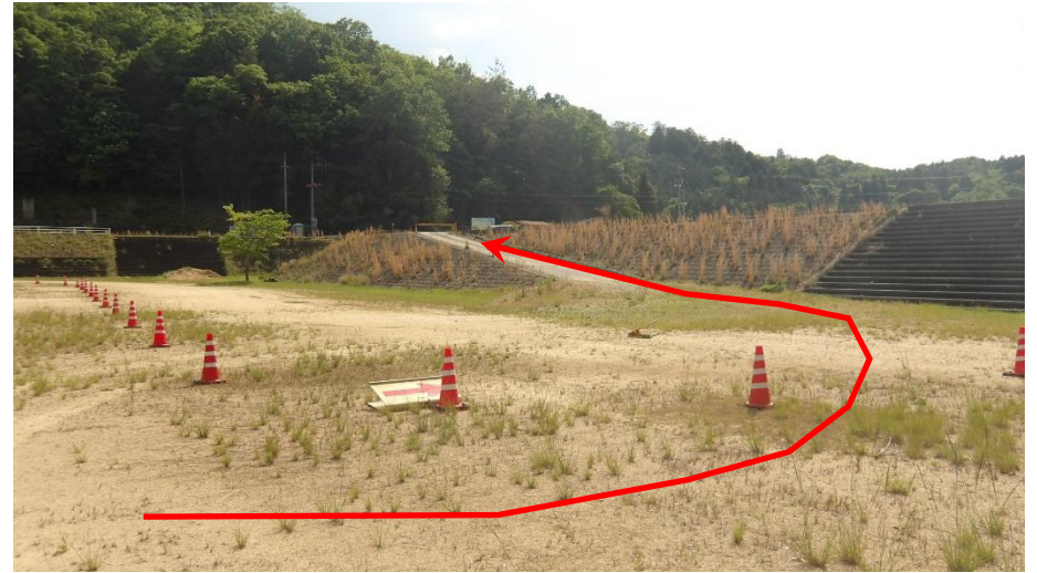
配布会場からの退場方法