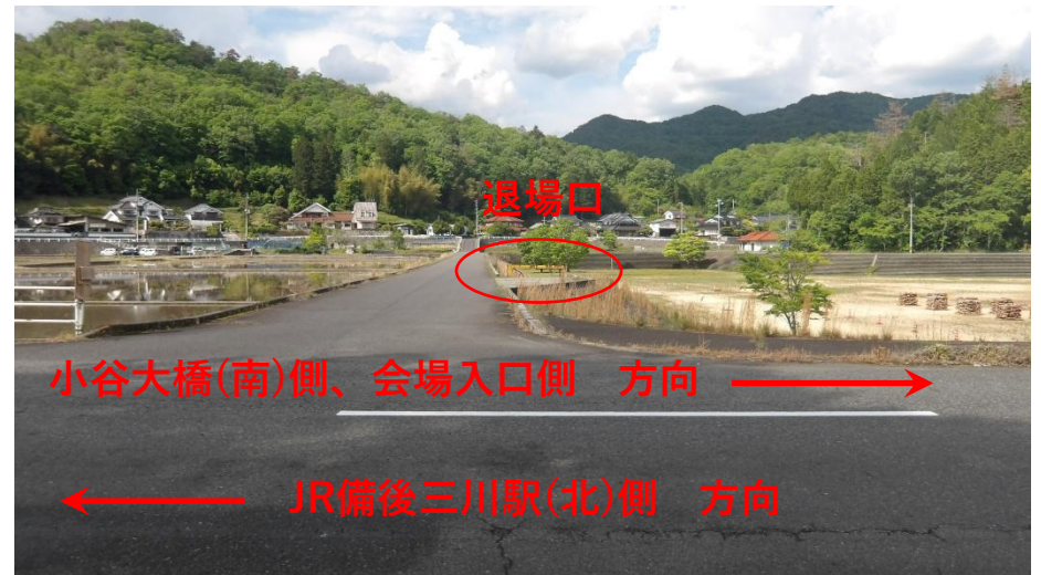
退場口以降の状況