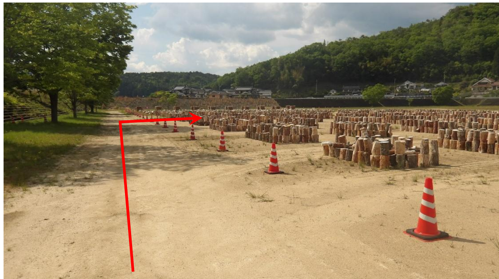
配布会場への進入方法。