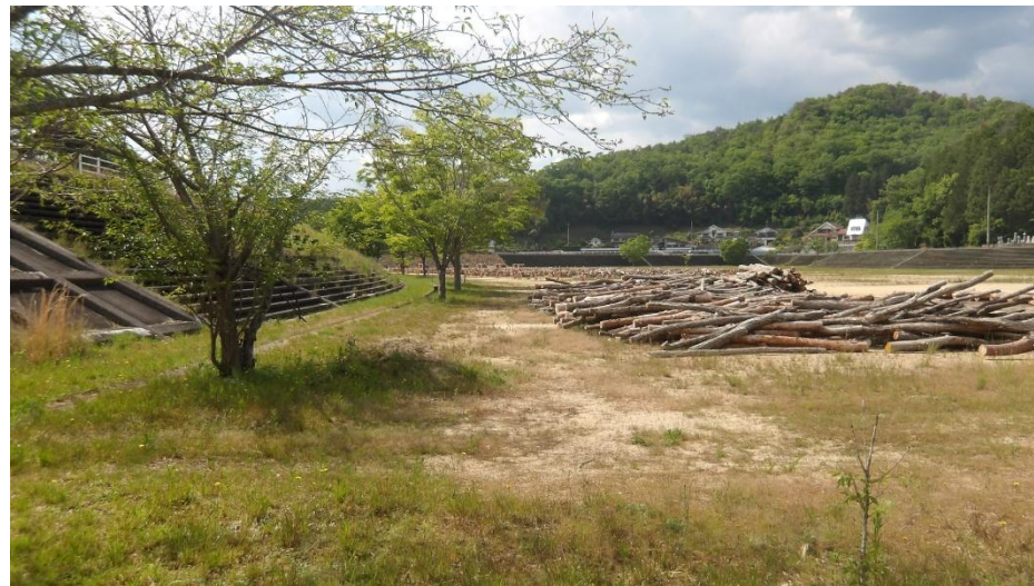
入ってすぐの個所には入らないでください。