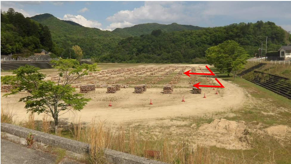
伐採木配布会場には道路側から進入してください。

配布場所での車の進入方向は絶対に順守してください。 先の車両は配布木の端部付近へ詰めてください。