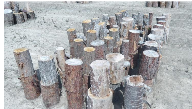
長さ30cm、会場手前側に配置