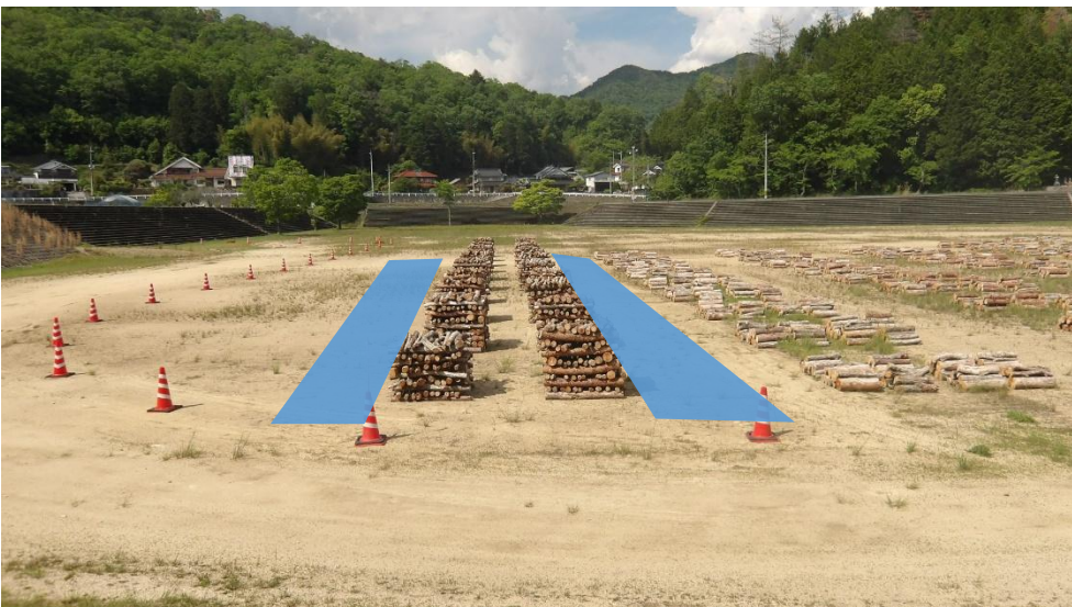
1.2mの希望者は上記個所へ進入してください 中央部は狭いため、進入禁止