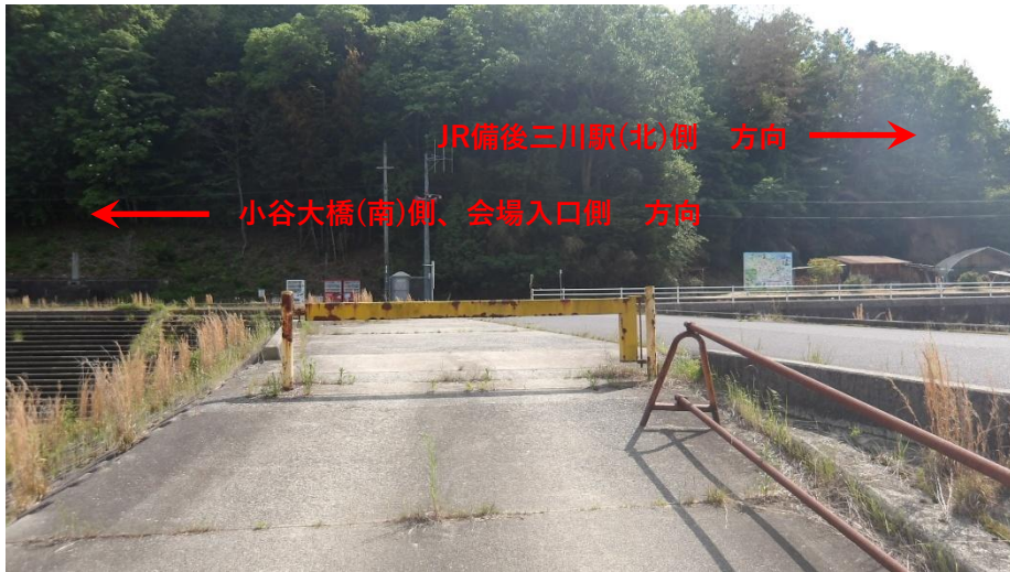
退場口状況 (9:15開門、15:45閉門)