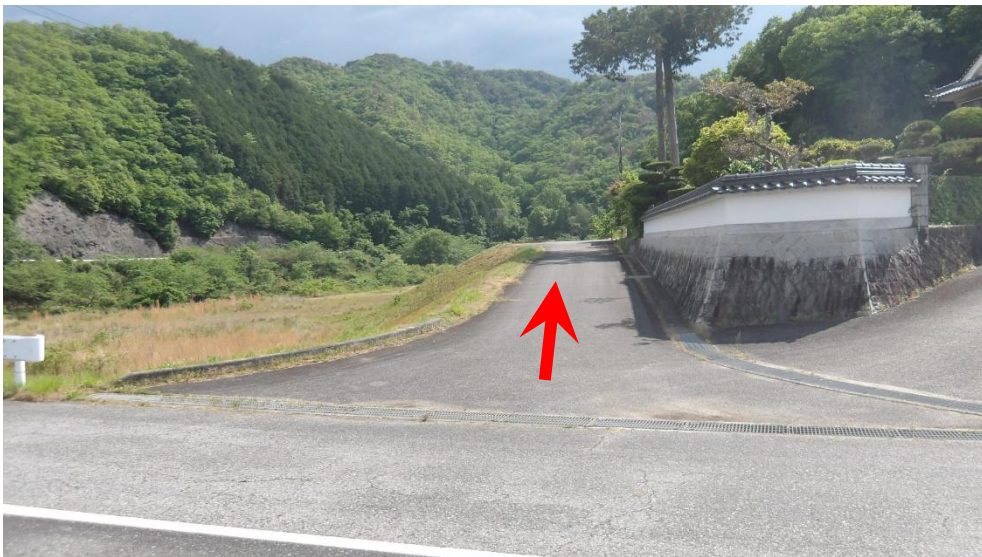
会場への進入路状況（入口）