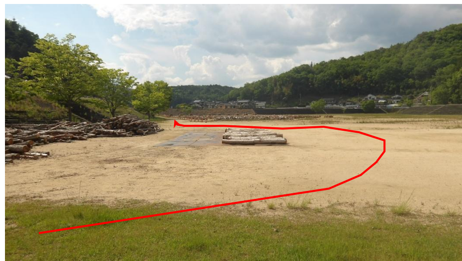
伐採木配布場所へのルートです（進入側より）