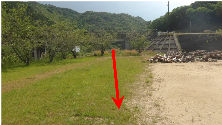
橋梁下を通過後、下流側へ走行します。