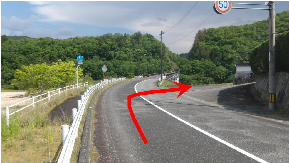
JR備後三川駅側（北側）からの進入路状況

会場の入り口は公園の上流側にある河川坂路にあります。一方通行で運用しますのでご協力ください。