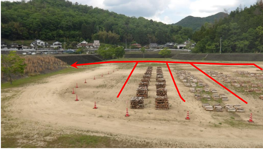
退場口には一度抜けてから移動してください

・会場北側にある坂路から退場してください。また、退場口からの進入はできません。再進入は入り口側へ回ってください。