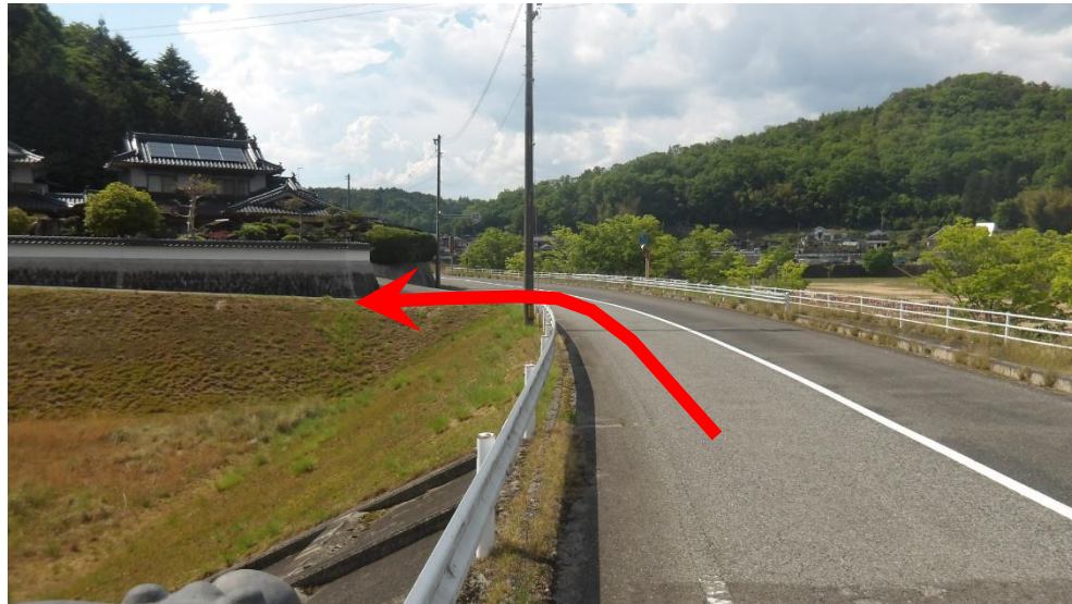
小谷橋側（南側）からの進入路状況