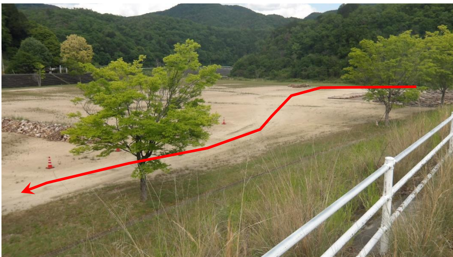
伐採木配布場所へのルートです（俯瞰）