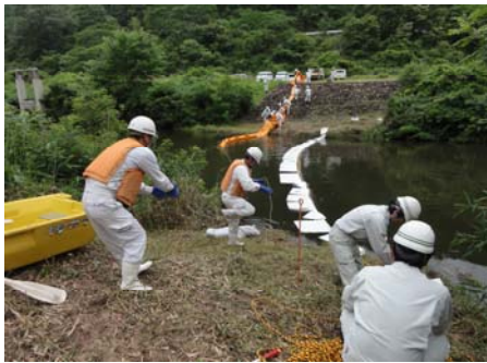
昨年度の実施状況

※報道関係者の方は、以下のとおり対応させていただきます。 平成28年6月30日(木) 14:00～16:00まで(別紙訓練場所)