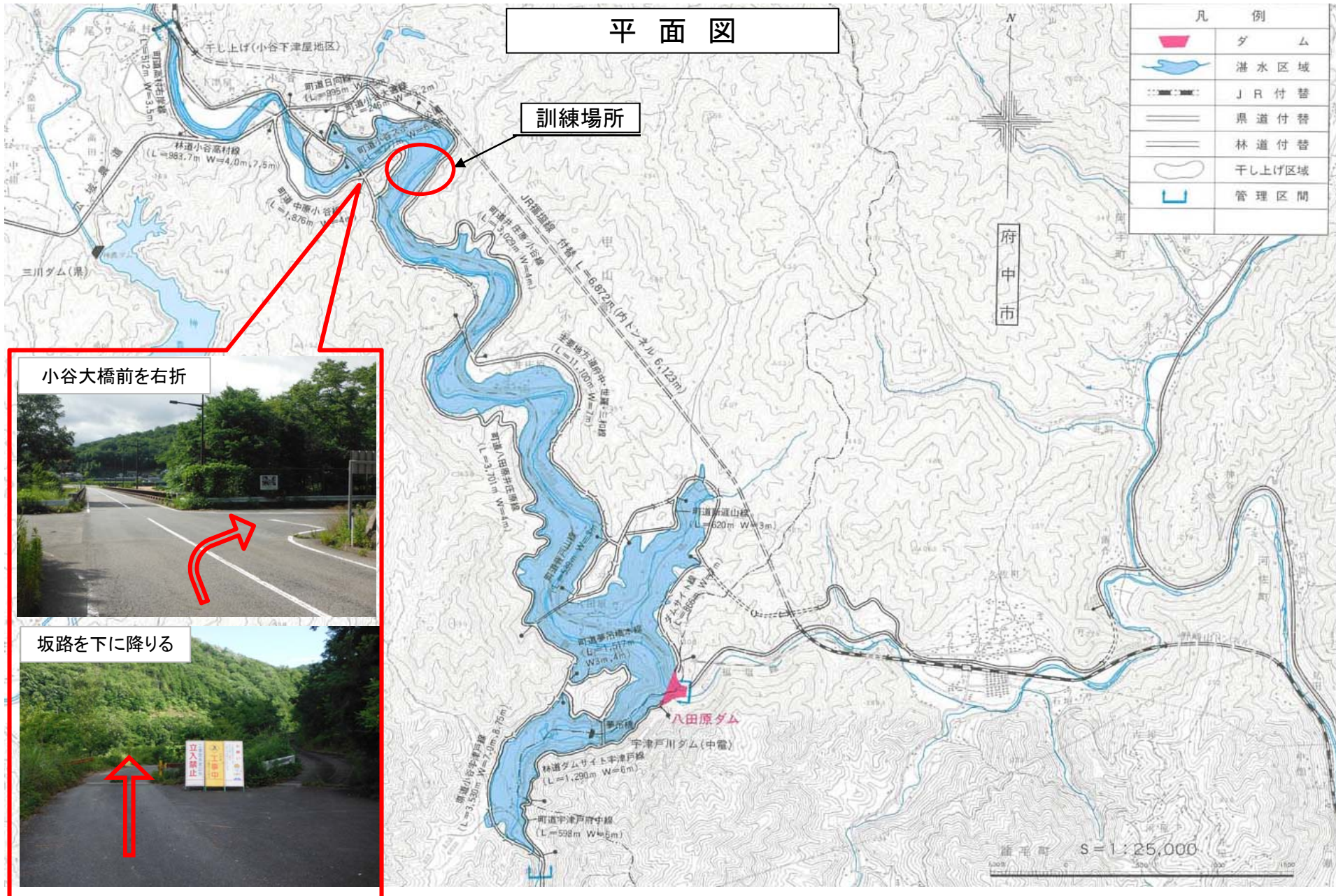
小谷大橋前を右折