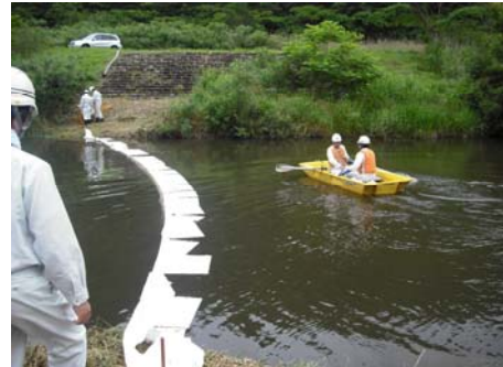
昨年度の実施状況