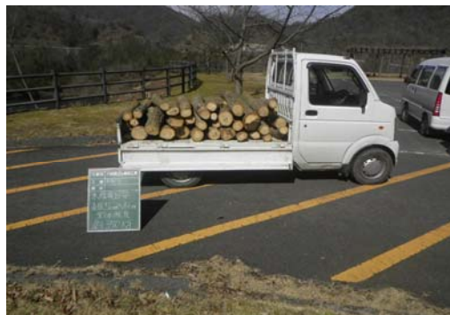
写真-軽トラックへの積み込みイメージ