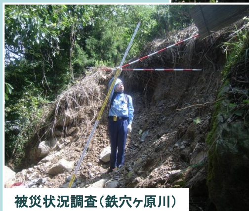
被災状況調査(鉄穴ヶ原川)