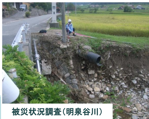
被災状況調査(明泉谷川)

8月26日より日野川河川事務所から第2陣TEC-FORCE隊員として派遣した職員2名が、8月30日に任務を終了し帰還しました。現地では、島根県邑智郡邑南町の調査を行いました。