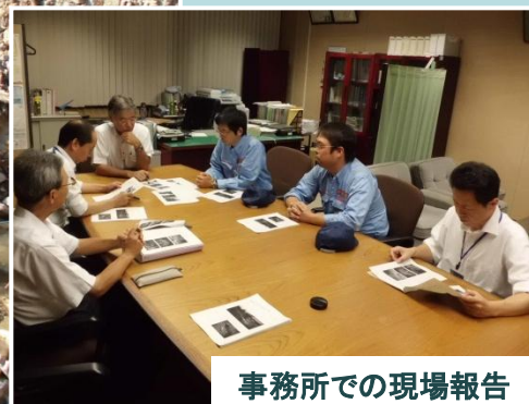
事務所での現場報告

なお、TEC-FORCEにより把握した河川、道路等の被災状況等は中国地方整備局HP『防災情報』( http://www.cgr.mlit.go.jp/saigai/saigai/index.htm )で確認できます。