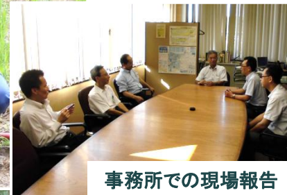
事務所での現場報告