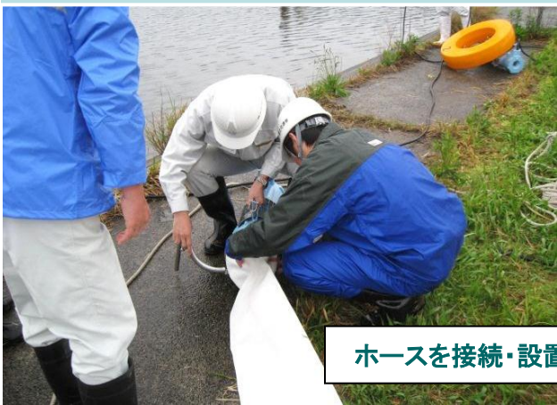
ホースを接続・設置