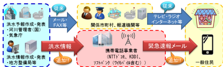
「洪水情報のプッシュ型配信」イメージ

ワイモバイル： http://www.ymobile.jp/service/urgent_mail/