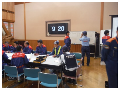
タブレットを使用しての災害情報収集および登録・送信