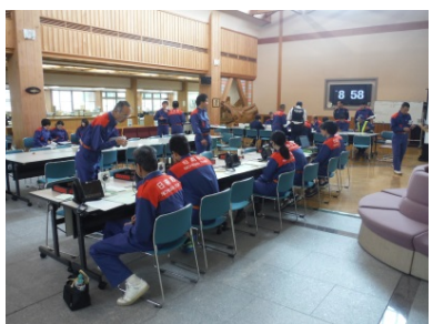
日南町災害対策本部