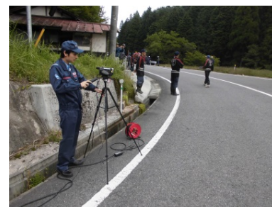
Ku-SAT II 現地送信装置(日南町福寿実)