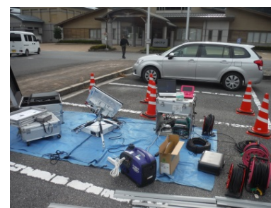
Ku-SAT II 受信装置(日南町役場)