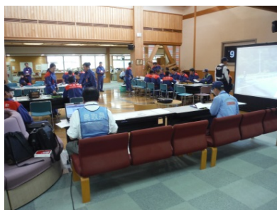
国・県からのリエゾン