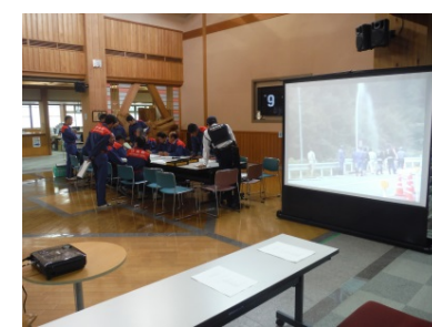
災害対策本部への映像投影