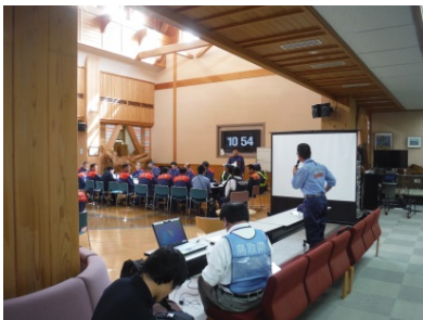
訓練終了後の反省会