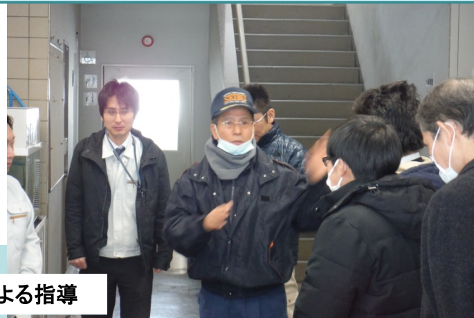
消防署員による指導