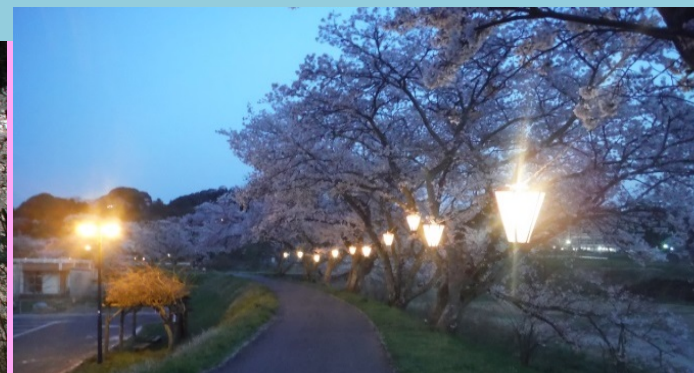
法勝寺川桜土手の幻想的な様子