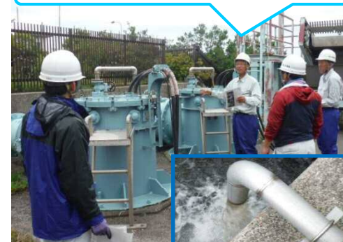
点検用配管から排水！