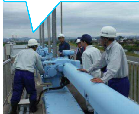
樋門操作盤内ブレーカ復旧訓練中