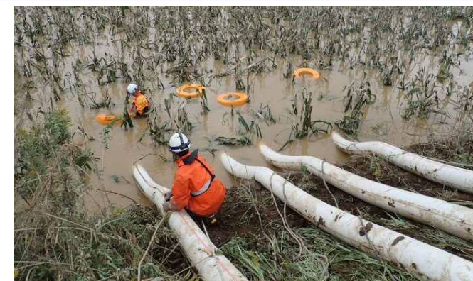
排水ポンプ設置作業の状況