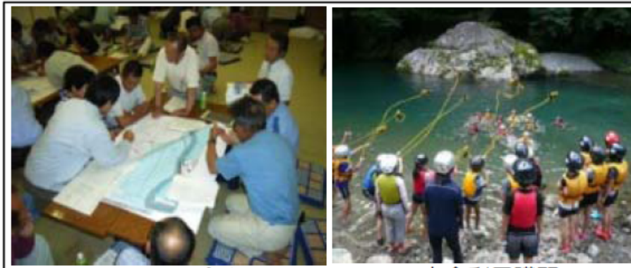
マイ防災マップづくり