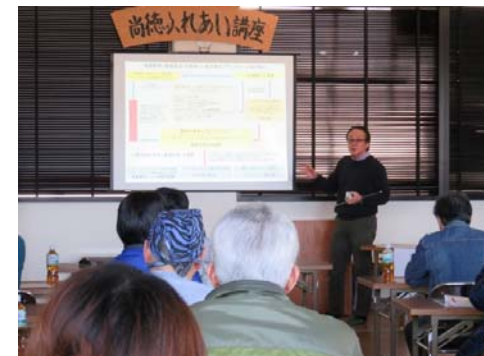
「海藻肥料の現状と地域再生」に関する講演