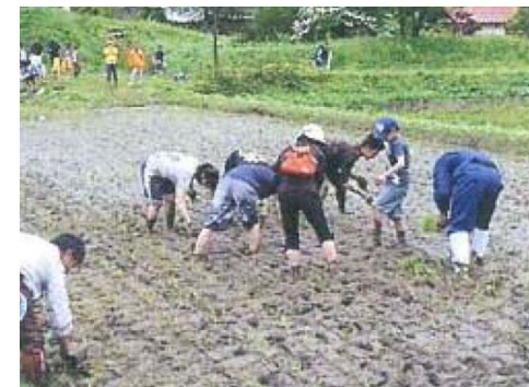
海藻肥料を利用した田植えイベント