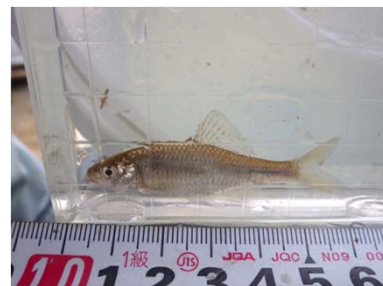
絶滅危惧種(ミナミアカヒレタビラ)