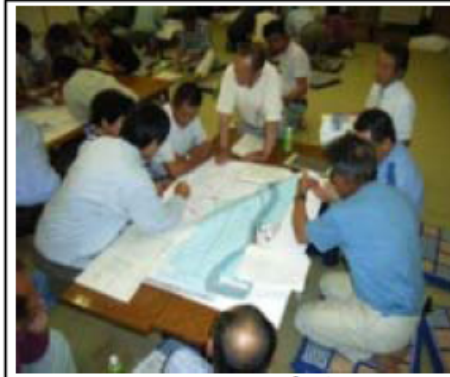
マイ防災マップづくり