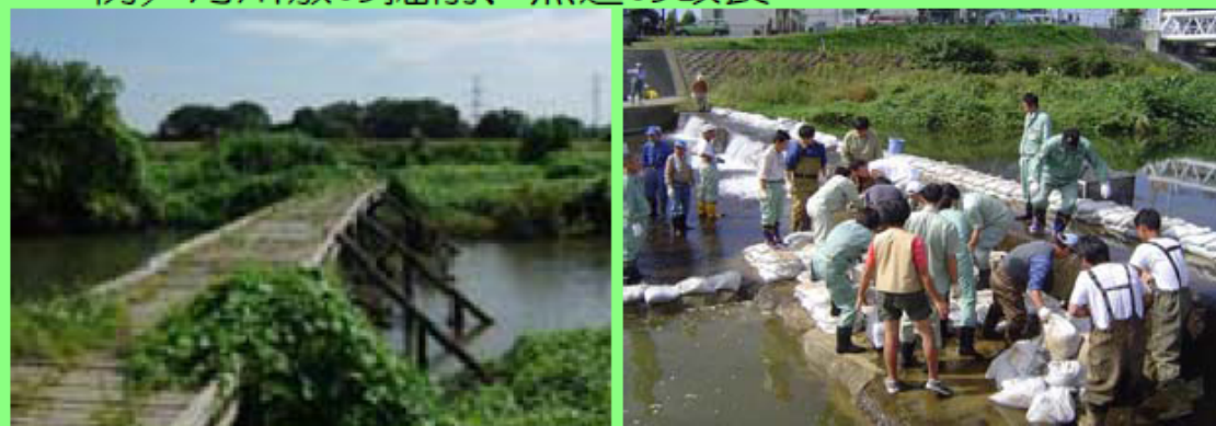
ピオトープの整備