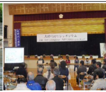
シンポジウムの開催