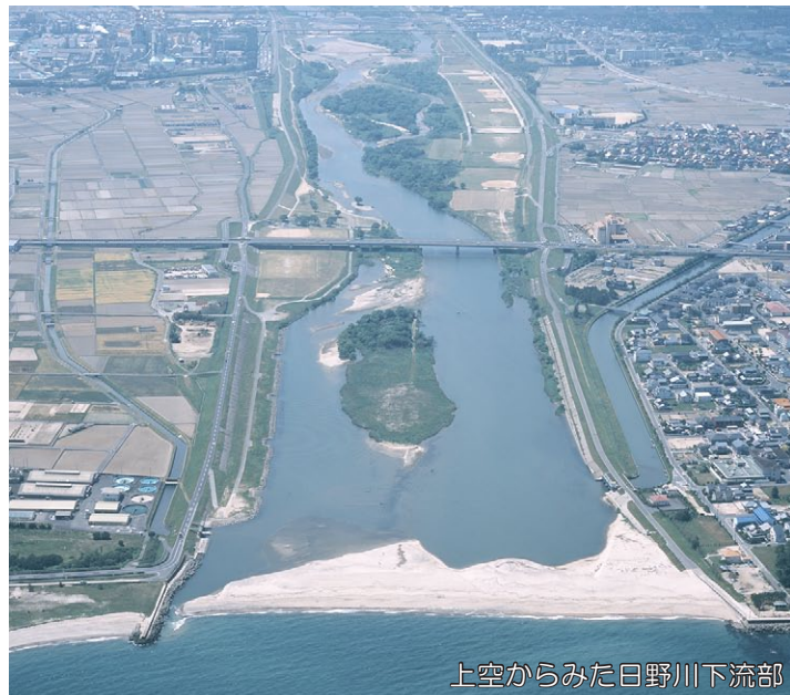
上空からみた日野川下流部

今後は、「日野川ニューズレター」を通じて、会議の開催予定や計画原案の作成状況などをお伝えします。