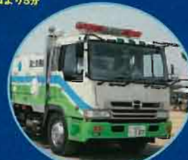
国土交通省の排水ポンプ車