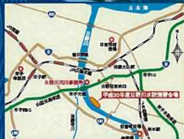
山陰自動車道日野川東出口より5分