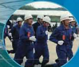
水防団員の出勤模様