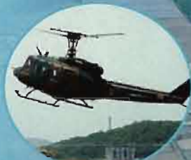
陸上自衛隊のヘリ