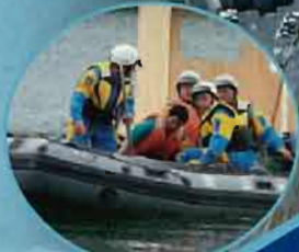
警察による孤立者の救助訓練