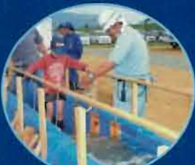
洪水体験コーナー