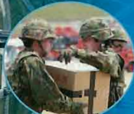
陸上自衛隊による緊急物資の輸送訓練