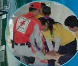
日赤による応急処置の講習