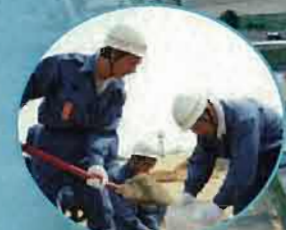
水防団による土のう作りの様子

消防・警察・自衛隊などの防災機関が連携し、 ヘリコプターによる人命救助等の特別訓練を行います