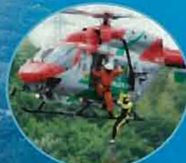
消防による漂流者の救助訓練