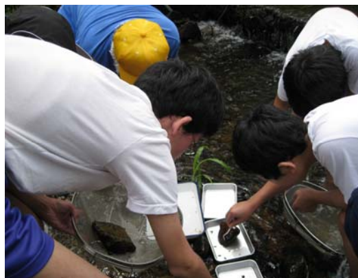
法勝寺中学校 (宮の前橋 (南部町馬場地先))