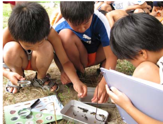
米子市子どもエコクラブ (米子市上福原地先) 溝口小学校 (鬼守橋 (伯耆町宇代地先))