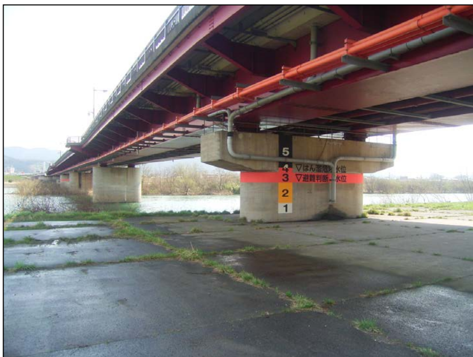
○千代川 八千代橋左岸 橋脚水位表示