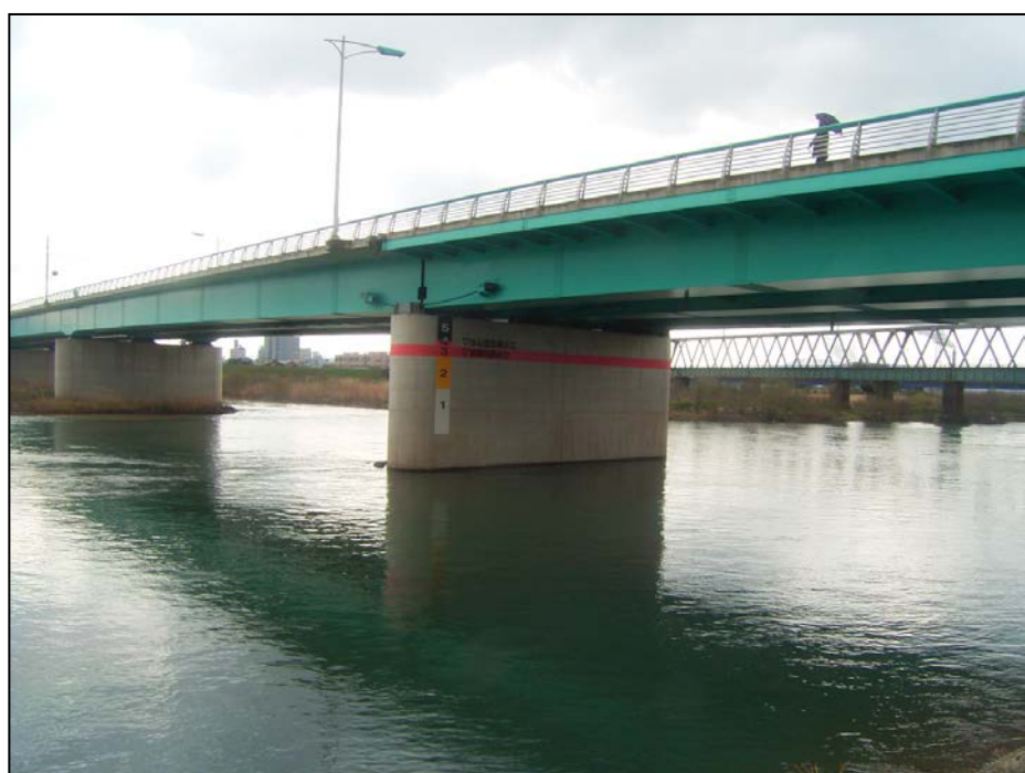
○千代川 新千代橋左岸 橋脚水位表示