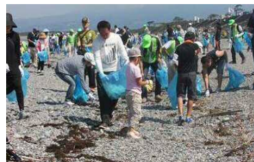
海岸環境の維持 (清掃活動)