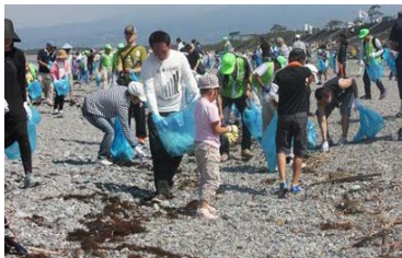
海岸環境の維持 (清掃活動)