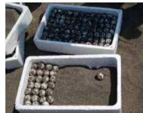
希少種保護 (ウミガメ卵の保護)