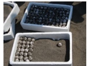
希少種保護 (ウミガメ卵の保護)