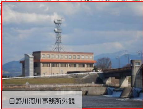
日野川河川事務所外観

「日野川管理室」は日野川河川事務所 1 階に職務室があります (旧日野川出張所と同じ場所であり連絡先も変わりません) 場所：米子市古豊千 6 7 8 連絡先：0859-27-3464