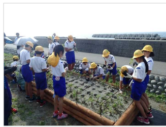
海浜植物の植栽・保護 [富山県：下新川海岸]