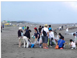
海岸清掃活動 [新潟県：新潟海岸]