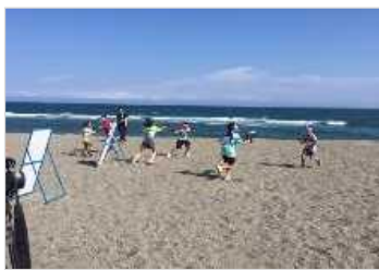
海岸PR活動（水鉄砲大会） [高知県：高知海岸]