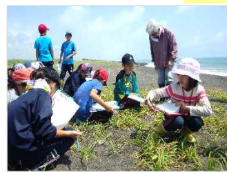
環境教育活動 [北海道：胆振海岸]