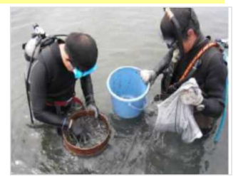
生物育成環境モニタリング [兵庫県：東播海岸]