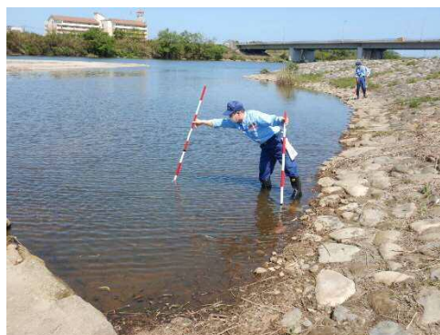
【昨年の点検の様子】