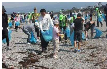
海岸環境の維持 (清掃活動)