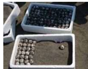
希少種保護 (ウミガメ卵の保護)