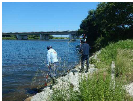
【昨年の点検の様子】