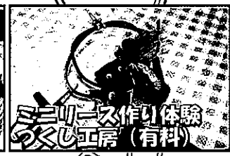
ミニリース作り体験のくし工房(有料)