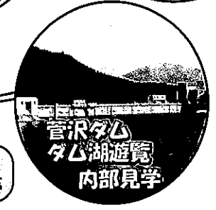
菅沢ダムダム湖遊覧内部見学