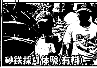
砂鉄採り体験(有料)