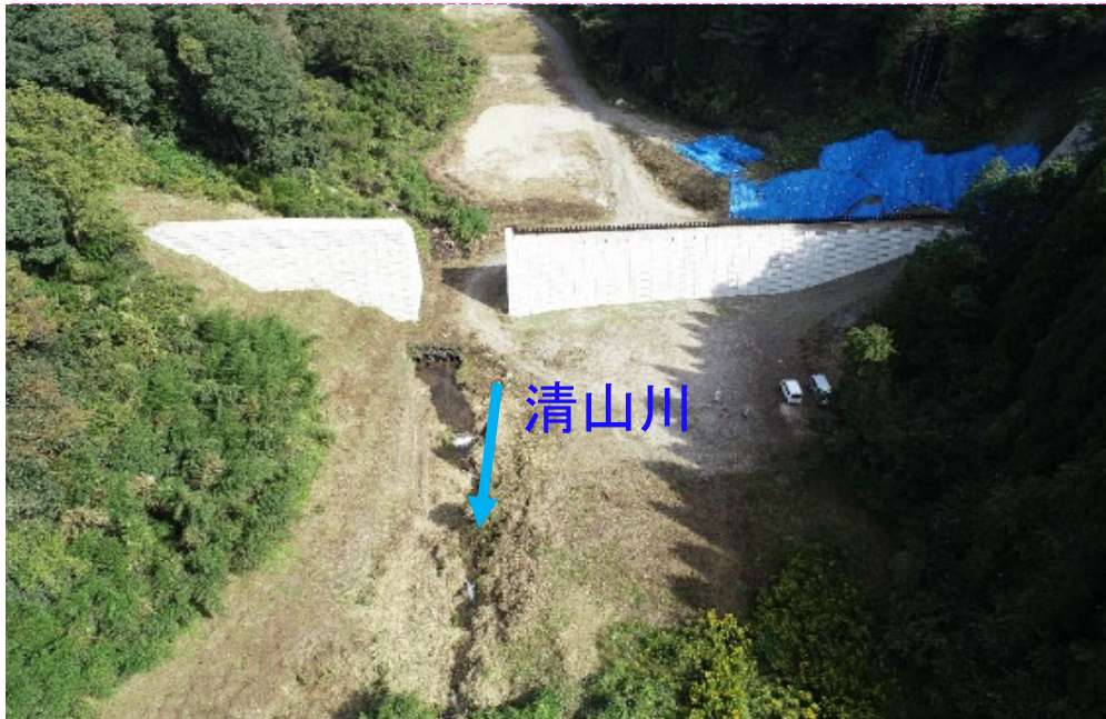
完成(側壁工、鋼製スリット)