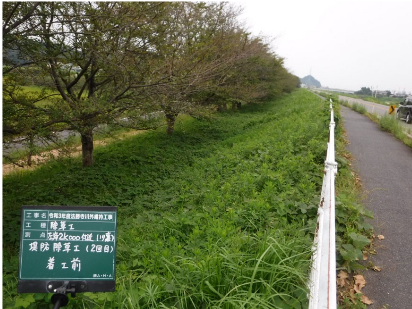
堤防除草着手前(米子市榎原地区)