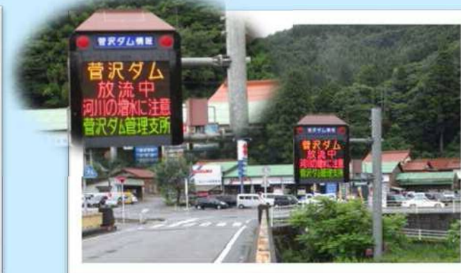
○情報板に放流状況を掲載