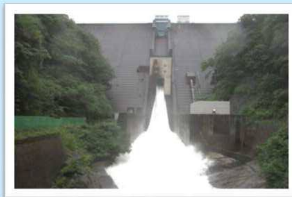
○常用洪水ゲートからの放流状況